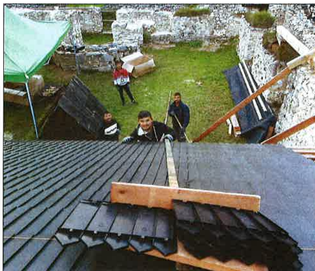
Zamestnanci národného projektu „Ľudia a hrady“ pri prestavbe a obnove prestrešenia malej krížovej chodby.

SPRÁVA O STAVE HRADOV NA SLOVENSKEJ ZA ROK 2022