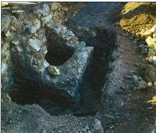
Nález šachty s odtokom pod zaniknutou toaletou mniškeho príbytku. Severná strana kláštora

• Skúmali sa stavebné fázy (pôdorysné úpravy) a konzervovali múry stredného kláštora. Obnovená bola strecha lapidária - náleziska býv. malej krížovej chodby (210 m 2 ).